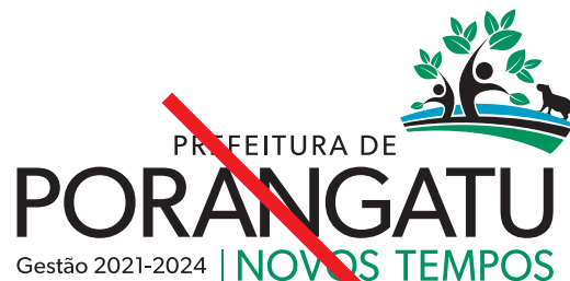
Alterar a posição dos elementos