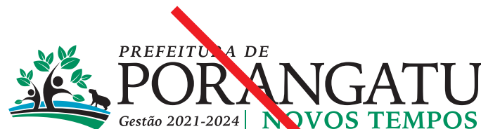
Alterar a tipografia